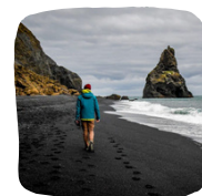
Black Sand Beach