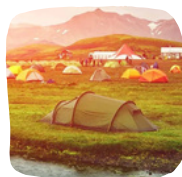
Διαμονή σε καταφύγιο